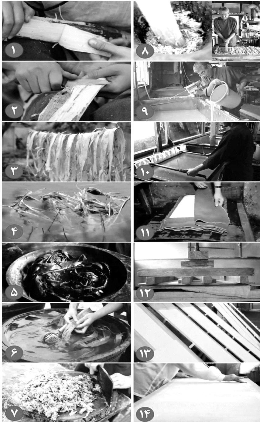
شکل ۲. مراحل ساخت کاغذ از پوست درخت توت